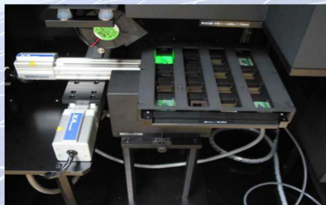
オートサンプルチェンジャー16 試料

【記載の仕様および外観は予告なしに変更する場合があります No.WebFlyer-CEP-2500AS-1505YN09】