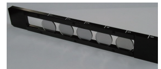
ND フィルタ (オプション)